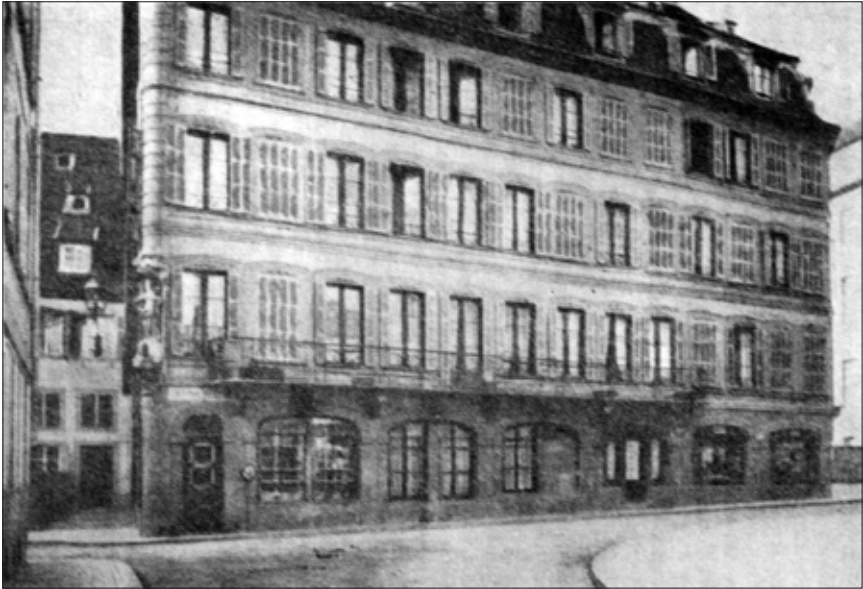
Maison habitée par Cagliostro pendant son séjour à Strasbourg Maison dite « de la Vierge », actuellement Kalbsgasse n° 1

en avaient bénéficié, le désintéressement de Cagliostro, tout cela était trop nouveau, trop attirant pour que du Nord et du Sud, savants, théologiens, curieux, n'accourussent pas vers le demi-dieu implorer de lui la santé, solliciter quelques bribes de ce savoir, quelque atome de cette puissance qu'il manifestait si généreusement.