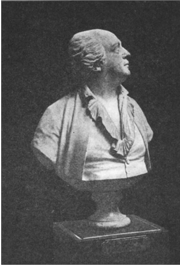
Cagliostro Buste par Houdon, profil, musée d’Aix-en-Provence

Il conserva de bons amis à Saint-Pétersbourg ; lors de l’Affaire du Collier, il fit appel au témoignage du baron de Corbéron, alors ministre plénipotentiaire près du duc des Deux-Ponts, pour qu’il déclarât ce qu’avait été sa vie à Saint-Pétersbourg, quel souvenir il y avait laissé et dans quelles conditions honorables il avait quitté cette ville.