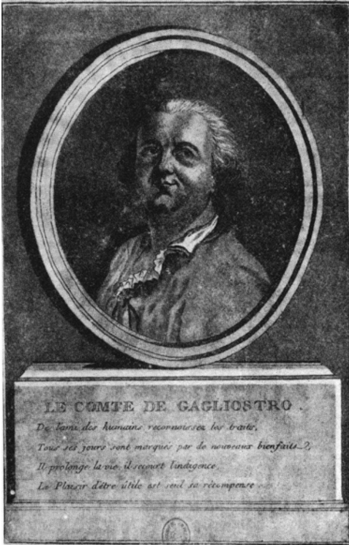
Portrait gravé par J. - B. Chapuy, d'après Brion de la Tour

maître dont les disciples s'exprimaient ainsi ? Quel pouvait être l'homme capable d'inspirer de pareils enthousiasmes ?