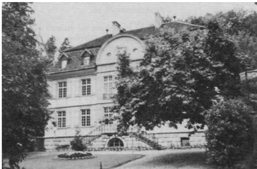
Rockhalt à Bienne