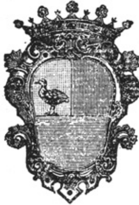
Armoiries de Cagliostro