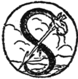
Cara figlia e Sorella Sceau de Cagliostro

Les signatures de Cagliostro sont rares : il écrivait peu et signait ses lettres, soit de son prénom 911 , soit de son sceau : le serpent percé d'une flèche, apposé sur cire verte. Ce cachet, dont nous reproduisons ici le motif, scellait le manuscrit du Rituel de la Maçonnerie égyptienne 912 .