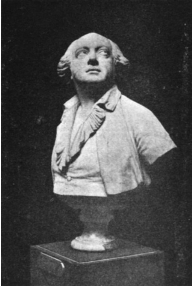
CAGLIOSTRO Buste par Houdon, face, Musée d'Aix-en-Provence

de Cagliostro étaient encore bien plus éloignés. Donc, même s'il n'y avait pas eu dans leur cœur des obstacles s'opposant à la satisfaction de leur désir, aucune raison supérieure ne pouvait engager Cagliostro à réaliser devant les yeux de ses disciples de multiples, de prodigieuses transmutations, malgré la facilité qu'il avait de le faire.